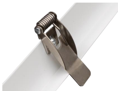
Pinzas metálicas de fijación